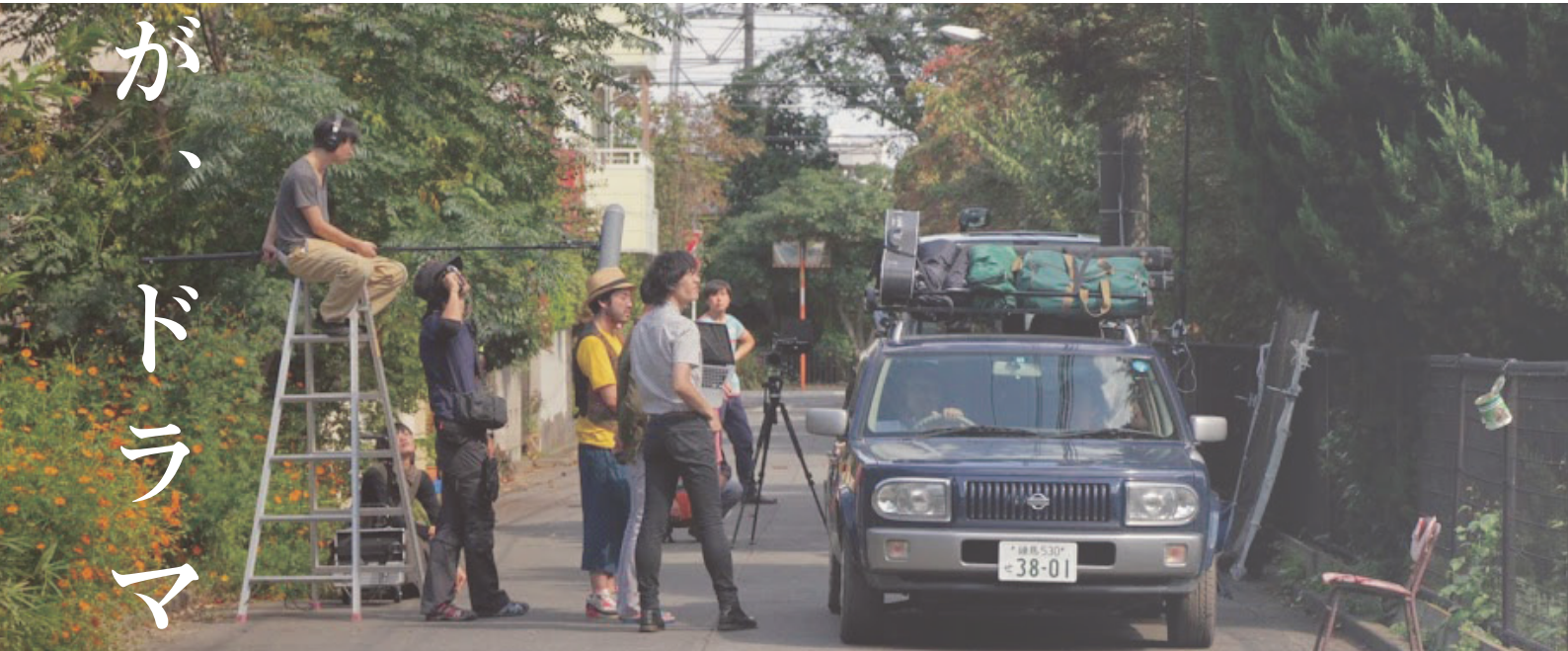
映画『ヴァレッジ・オン・ザ・ヴァレッジ』撮影風景