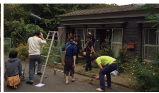
映画『ヴァレッジ・オン・ザ・ヴァレッジ』撮影風景