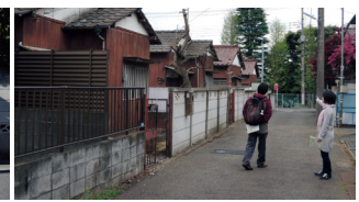
ロケ地発掘まちあるき