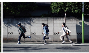
「けやきの名画座商店街」P/V